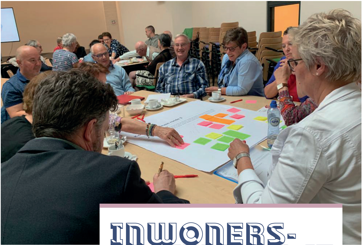
Sfeerimpressie werkconferentie 27 juni